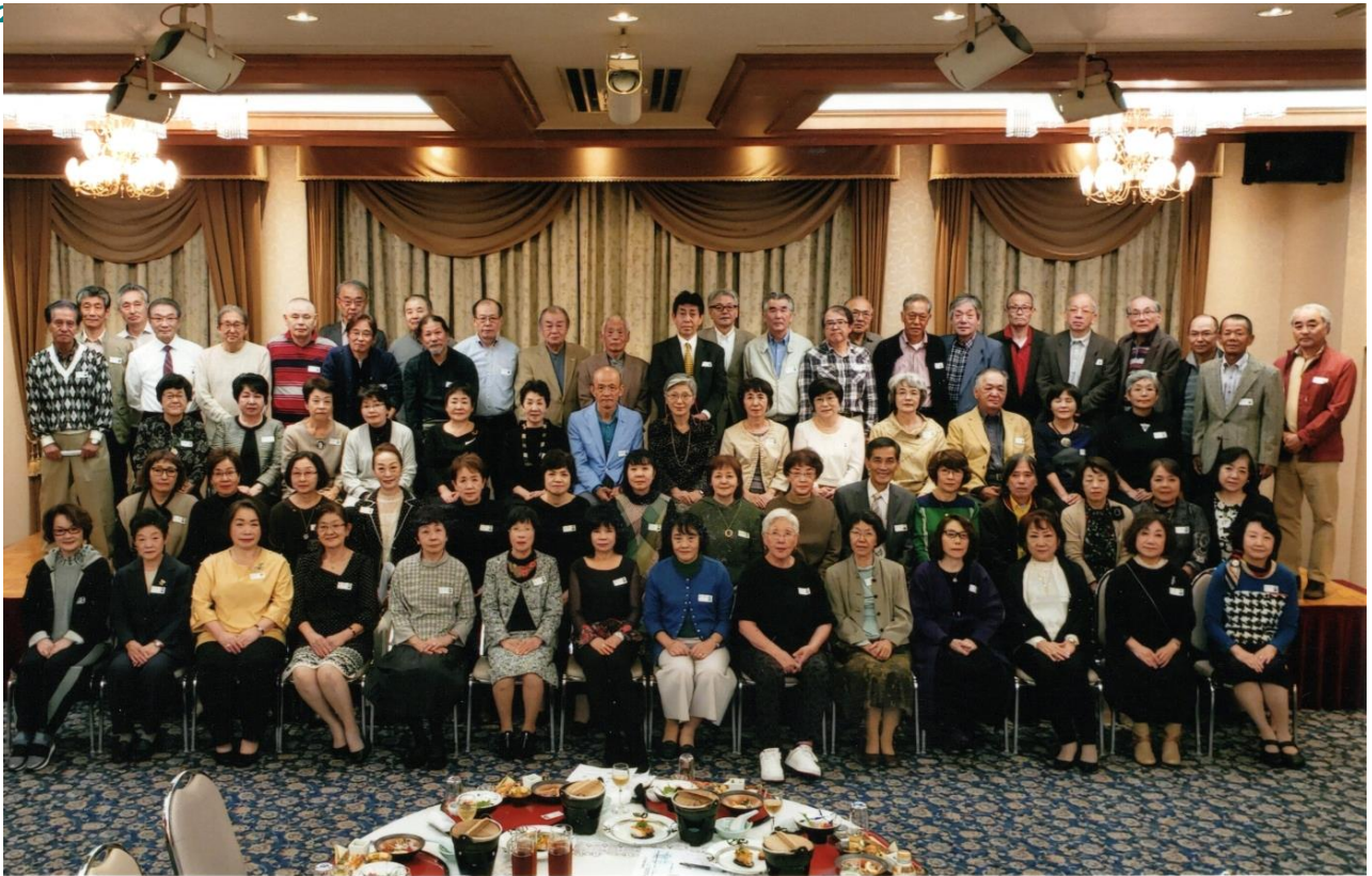
佐世保市立山澄中学校昭和42年卒業生同期会 令和元年11月3日