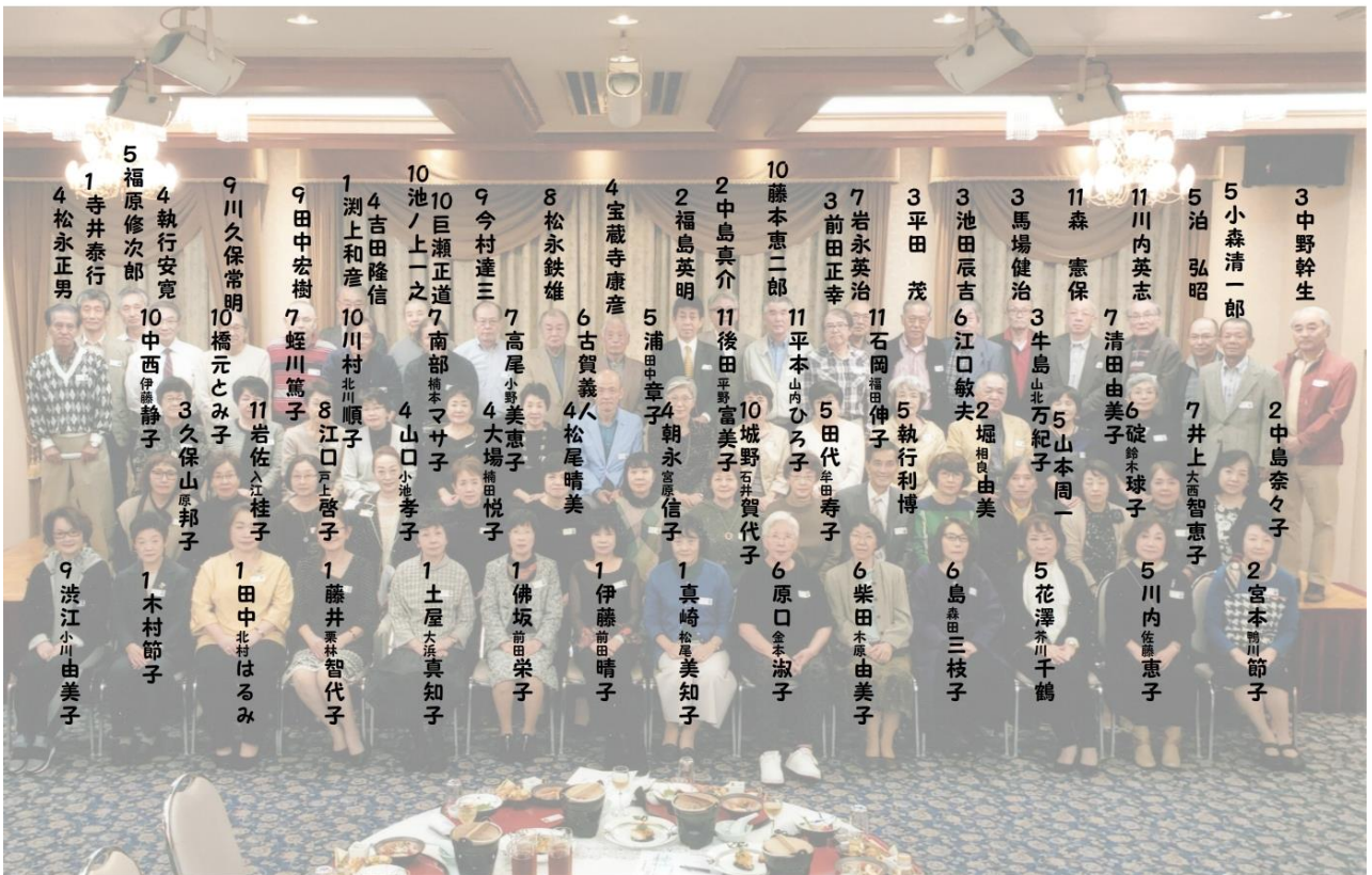
佐世保市立山澄中学校昭和42年卒業生同期会 令和元年11月3日